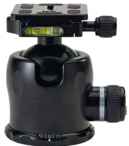
Κεφαλές για φωτογραφία