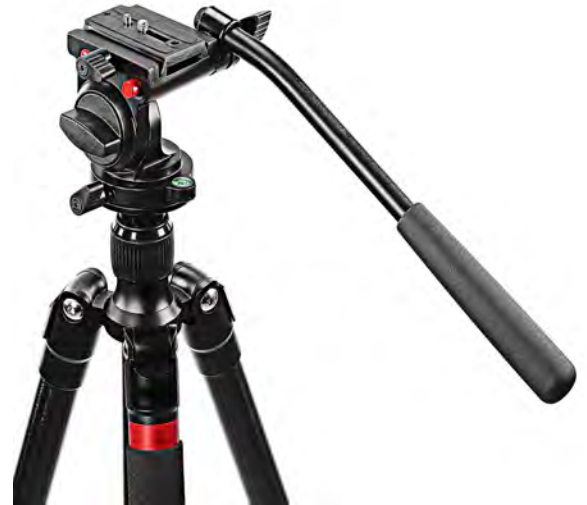
Κεφαλή για φωτογραφία & video